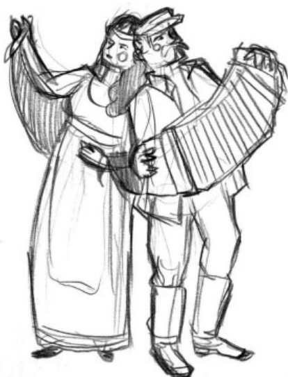
Рисунок Дарьи Казаковой