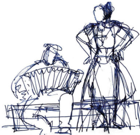
Рисунок Валерия Ржевского