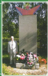
Путь к памятнику