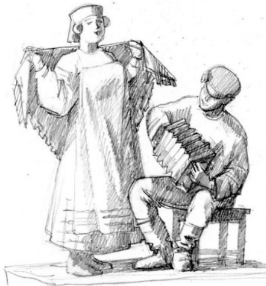
Рисунок Татьяны Власовой

С уважением Татьяна Власова, рязанский художник